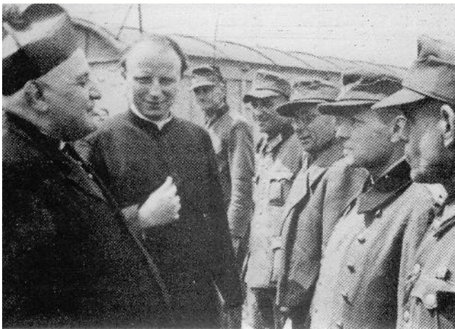
Nuntius Roncalli, der spätere Papst Johannes XXIII., bei einem seiner Besuche im Stacheldrahtseminar