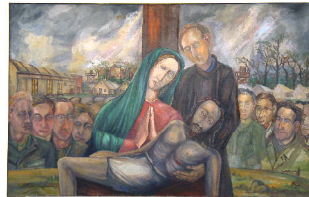
Gemälde von Franz Stock, 1946

Kathedrale Saint-Louis des Invalides, Bischofskirche der römisch-katholischen Diözese der französischen Armee, statt. Bisher war noch nie ein Deutscher hier geehrt worden. Er sollte der Erste sein.